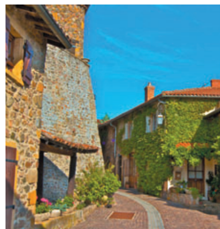
Un village du Beaujolais