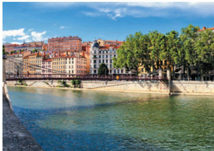
Lyon, quai de Saône

6 jours/5 nuits • à partir de 441€/pers. du 1 er jour dîner au 6 e jour déjeuner 3 demi-journées rando accompagnées : • La Croix Rampau (6 km, 1h45) • L'île de la table ronde (9,7 km, déniv. + 60 m, 3h30) • Lyon , découverte de Tony Garnier, le quartier des Etats Unis 3 journées rando accompagnées : • " La Toscane beaujolaise " (15,2 km, déniv. + 350 m, 5h20) • Lyon avec déjeuner dans un bouchon : le Vieux Lyon (9,8 km, déniv. + 200 m, 3h30), les pentes de la Croix Rousse jusqu'au centre-ville de Lyon (9 km, déniv. + 200 m, 3h30) • Les Monts du Lyonnais : le Val d'Yzeron (13,5 km, déniv. + 500 m, 5 h)