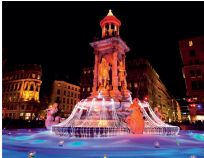
Lyon, Fête des Lumières